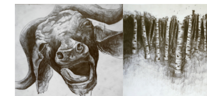
Pascal Laborde Roots, 2007